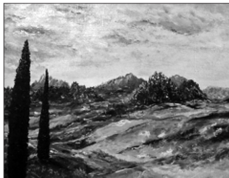
Сергей Соловьёв «Прованский пейзаж»