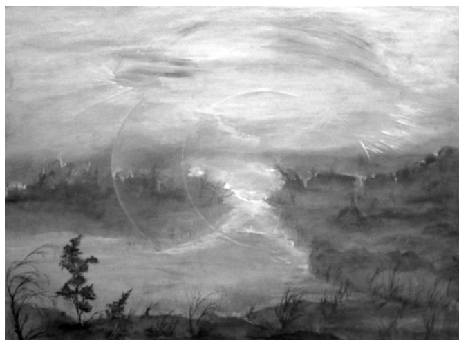
Татьяна Никифорова “Полёт кукушки над родным гнездом”