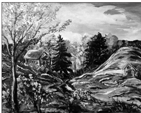
Сергей Соловьёв «Осень в деревне»