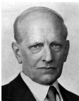
Рис. 1. Философ Николай Гартман (1882–1950)

основную проблему: можно ли говорить о традиции философствования в России, в русской культуре и принадлежит ли к ней Н.Гартман? Попытка позитивного ответа приводит нас к необходимости первым в ряду претендентов среди выпускников Санкт-Петербургского университета за все годы его существования поставить Николая Гартмана – получившего мировое признание творца новой онтологии (рис. 1).