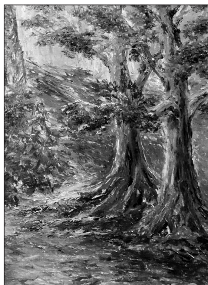
Сергей Соловьёв “Сад Петрарки. Прованс”

Sergey L. Solovyov. Essay on meaning of dreams