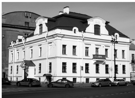
Рис. 2. Санкт-Петербургский Государственный Музей-институт семьи Рерихов (особняк академика М.П.Боткина)

После закрытия конференции Ю.Ю.Будниковой была проведена экскурсия по выставке Музея-института семьи Рерихов (рис. 2), посвященной 700-летию величайшего подвижника земли Русской преподобного Сергия Радонежского.