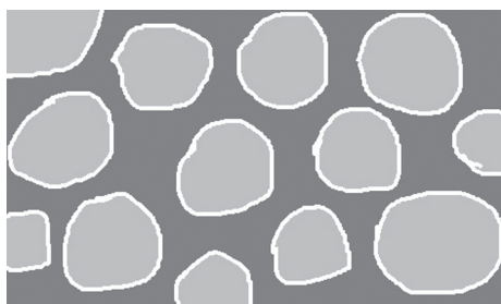
Рис. 1. Спонтанный умозрительный образ «акантолитических клеток»

гоид. Если первое заболевание требует назначения массивной системной глюкокортикостероидной терапии по жизненным показаниям и склоняет к отсрочке операции на легком, то второе протекает благоприятно и подобных мер не требует. В процессе клинического обследования аргументы в пользу каждого из дерматозов распределились приблизительно поровну. Ситуация для пациента сложилась критическая. Несколько дней прошли в безуспешных попытках решить эту проблему. Неожиданно в период «предсонного безмыслия» перед моими глазами возник на 2–3 секунды чрезвычайно яркий образ группы округлых клеток («изображенных» схематично, без подробностей) с ярко светящимися, как при люминесцентной микроскопии, стенками (рис. 1).